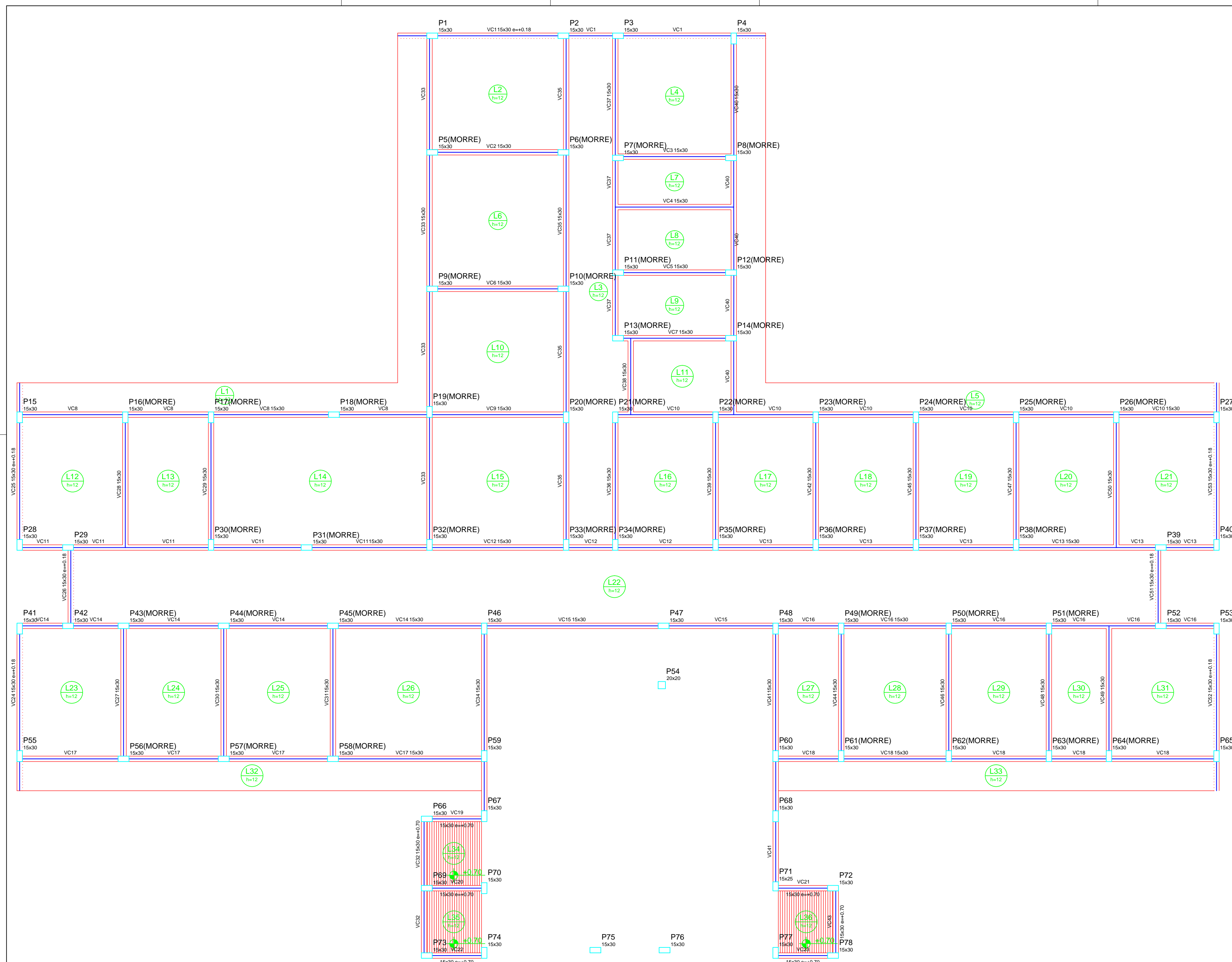
Forma do pavimento CINTA escala 1:50